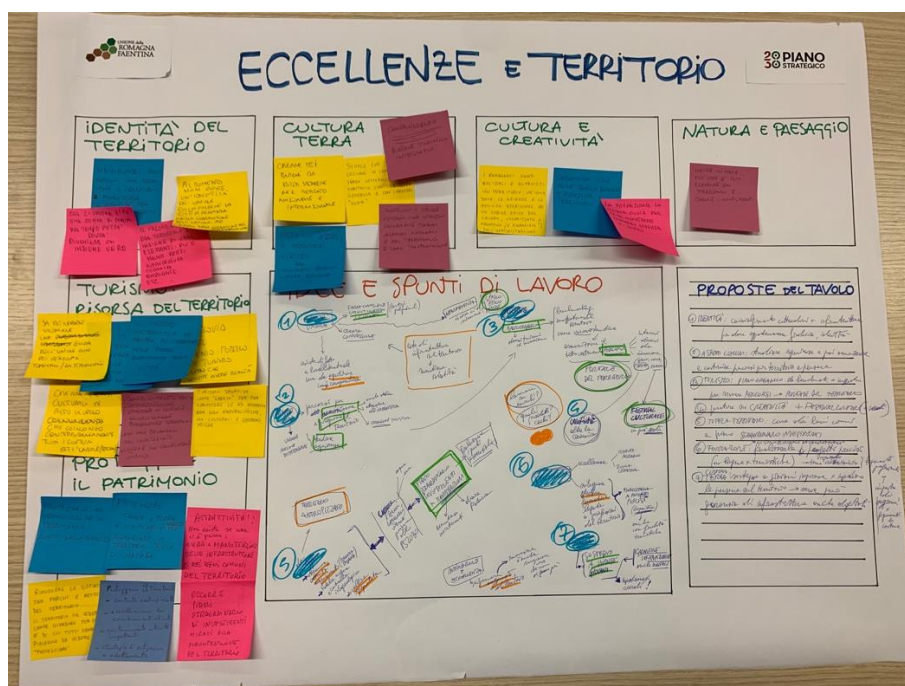
Tavolo di lavoro 1